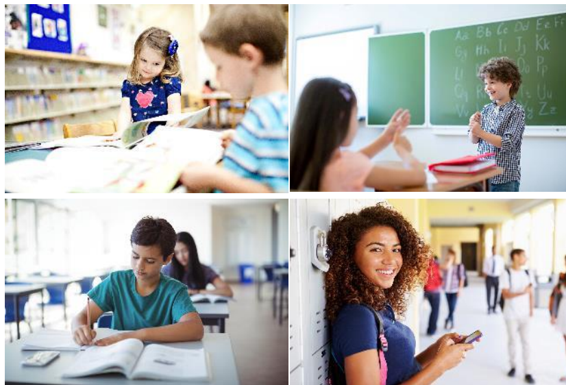
Gamme Alerte Attentat pour crèche, école, collège, lycée <200m 2

Etablissements scolaires de moins de 200m 2 , soit 2/3 des établissements scolaires en France - et édifices ne permettant pas de tirage de câbles