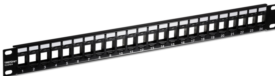
Tableau de connexion 1U Keystone vide à 24 ports