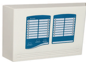
Réf. AT 16R