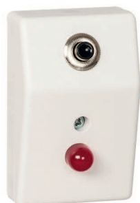
Réf. BRAT 1

Poids (avec emballage) : . . . . . 3300 g