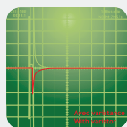
ELEKTRONISCHE BESCHERMING TEGEN HET SELF EFFECT